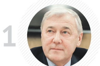
Комитет ГД по финансовому рынку АНАТОЛИЙ АКСАКОВ

ДЕПУТАТЫ ФРАКЦИИ «СПРАВЕДЛИВАЯ РОССИЯ – ЗА ПРАВДУ» ВОЗГЛАВИЛИ СЛЕДУЮЩИЕ КОМИТЕТЫ ГОСДУМЫ: