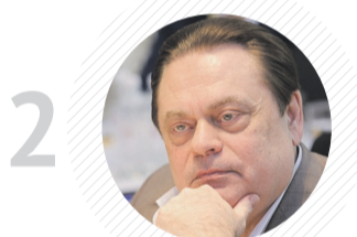
Комитет ГД по делам национальностей ГЕННАДИЙ СЕМИГИН